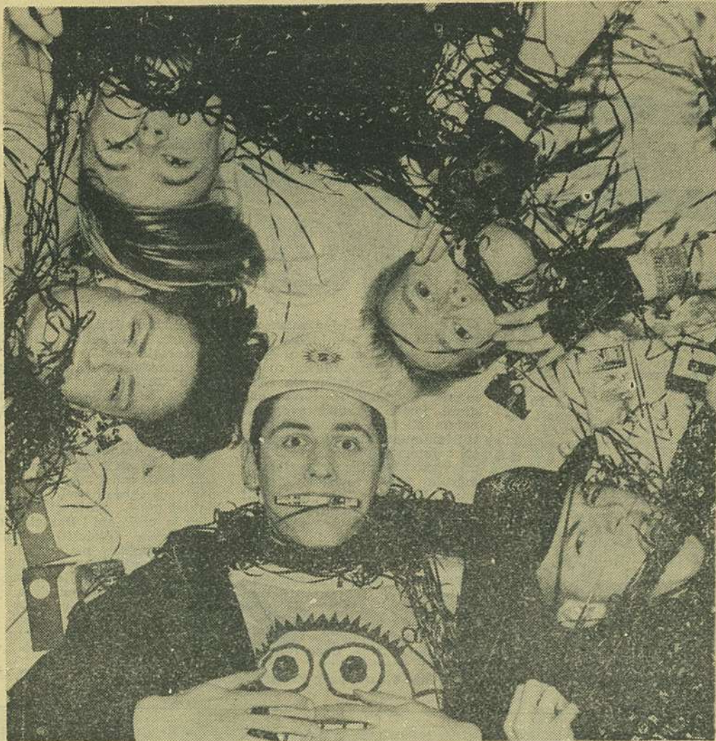
Jesus Jones, locul 9 în 1990 și în urma concertelor din...