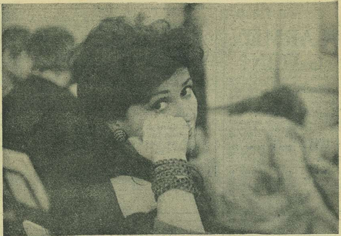
Ultima fotografie realizată de Dan Atanasoae în 1989