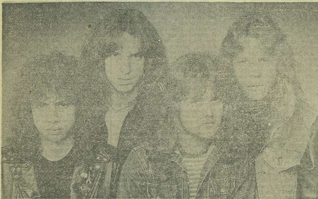
Prima poză din istoria grupului „Metallica”

asociați cu o poză bună ar fi salutar. Pentru actualii și viitorii tăi ascultători redau cîteva dintre preferințele tale: Mariah Carey — „Vision Of Love”, INXS — „Suicide Blonde”, „Justify My Love” — Madonna (video-clipul a fost considerat extrem de... hormonal, așa că nu cred că-l vom mai vedea la noi), Wilson Phillips — „Release Me” iar la „Top Rock”, Judas Priest, Iron Maiden, Gary Moore. Mulțumesc pentru „Lexiconul” expediat! Doar așa putem ajunge la o „bancă de informații” în domeniul nostru, domeniul care resimte acut lipsa unui reprezentant la nivelul decizional! Motanii din Brașov: mai întii mulțumiri lui