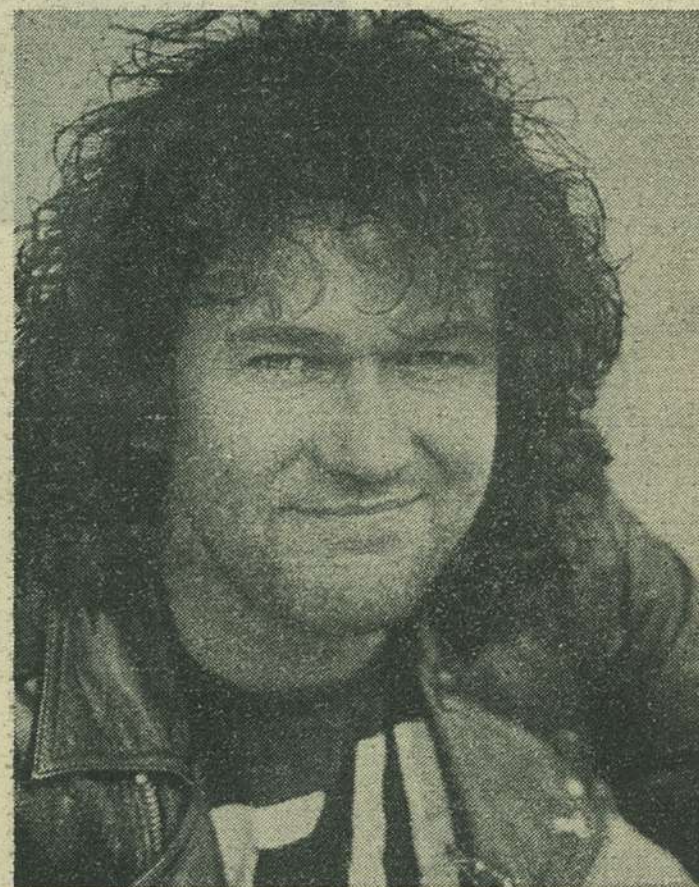
Jimmy Barnes, mare vedetă la Antipozii