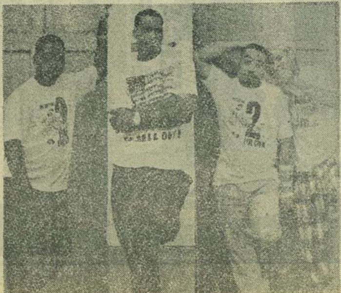
Mulț comentatul grup american 2 LIVE CREW

confectionate din vinyl și relex sint fabricate în două dimensiuni: pentru copii și adulți. Prețul este în jur de 20 dolari. (C.S.)