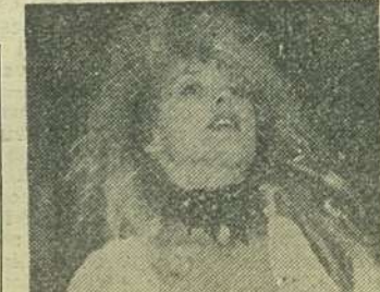
Joan Jett (5)