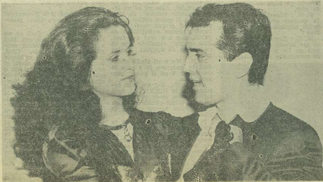
Un cuplu... de ocazie, o poză solicitată