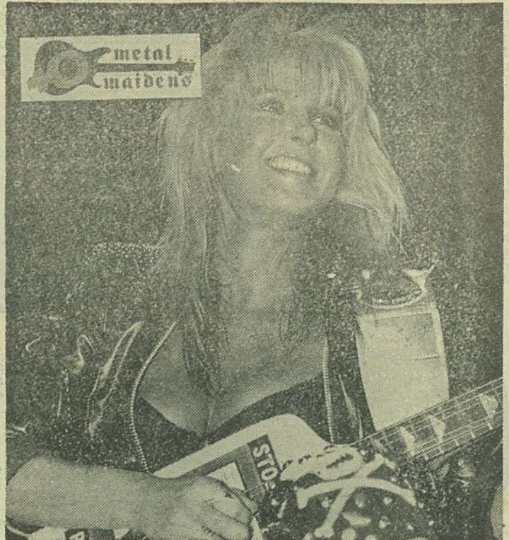
Lita Ford, locul 1 la fetele „Heavy”