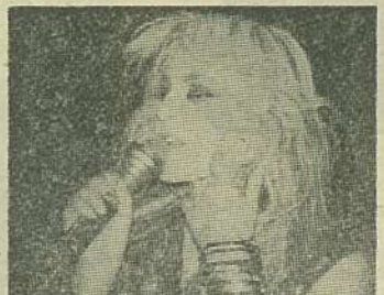
Doro Pesch (2)