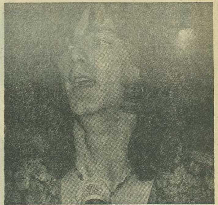
Chris Robinson (Black Crowes)