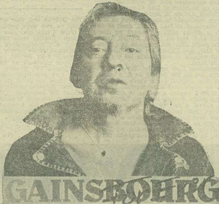
Serge Gainsbourg — „in memoriam”

nilor” am publicat un micreportaj în numărul 5 al P.R.S. Pentru cei care n-au cum să-și dea seama despre cine era vorba să dau și numele grupului (echivalent cu orice nume propriu și deci de respectat ca atare) cu pricina: Gipsy Kings!