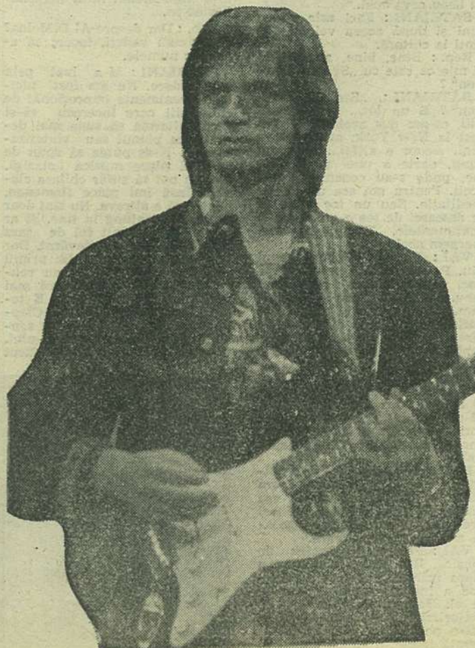
Traducere și adaptare M. G.