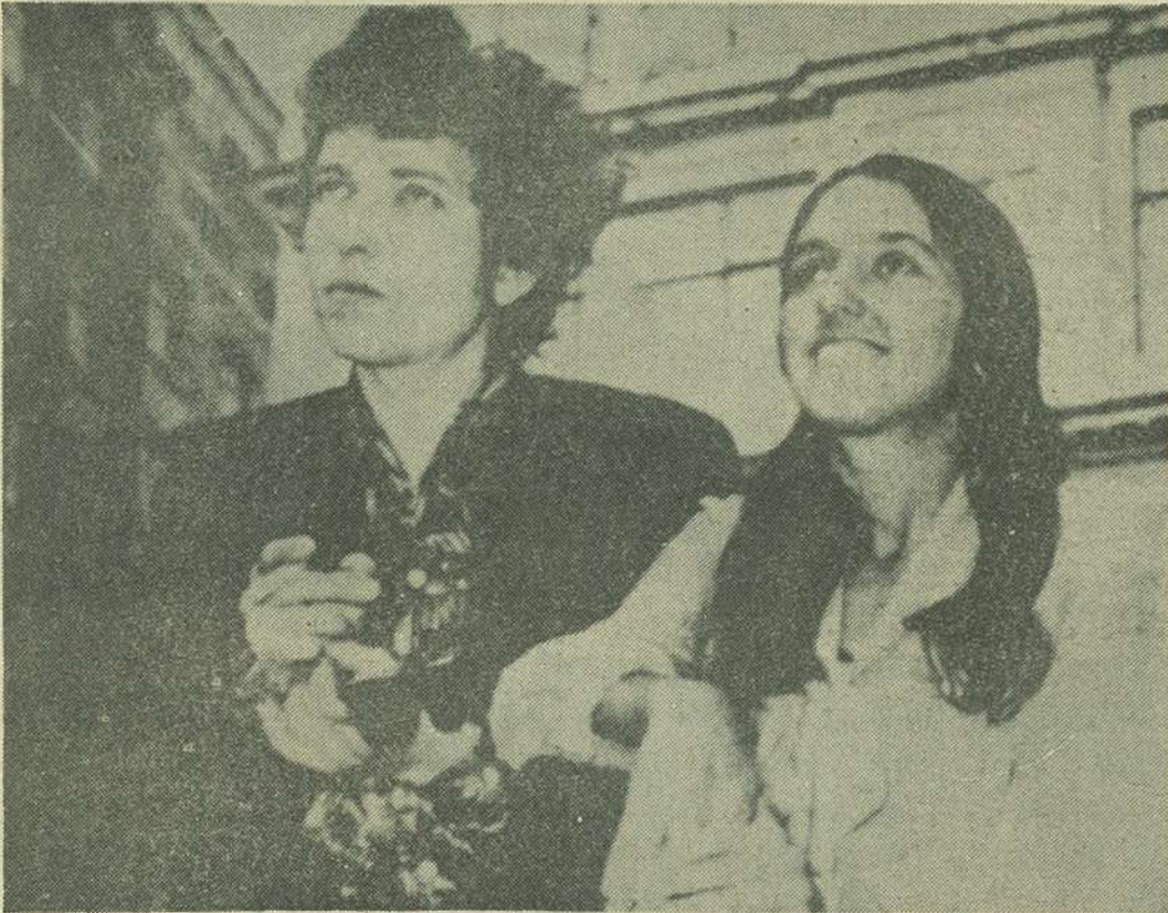
Bob Dylan și Joan Baez

● Lumea se pregătește să sărbătorească o jumătate de secol din viața lui Robert Zimmerman, alias Bob Dylan ● O întreagă generație a crescut cu cantecele sale ● „Regele folk-ului” a disprefuit întotdeauna orice ideologie. Poate și pentru această, imaginea sa a rezistat pînă astăzi