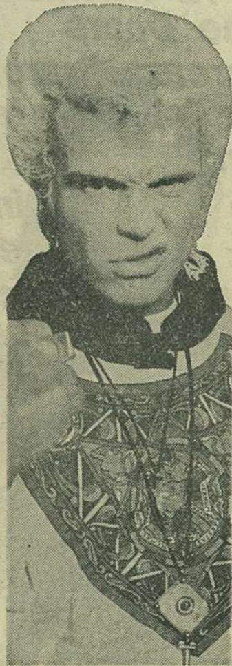
O datorie pentru fanii lui Billy Idol

● Apariția rapidă în partea superioară a topului american a lui Michael Bolton anunța o schimbare de orientare la „Billboard”, revista care realizează centralizarea datelor necesare pentru clasamente. Calculul se face acum prin culegerea cifrelor de vânzare din magazinele afiliate și nu în baza rapoartelor săptămânale primite de la magazine la ansamblul lor, care își anunțau lista cu produsele cele mai bine comercializate. Puterea muzicii country s-a demonstrat imediat după schimbarea sistemului. Garth Brooks a ajuns în top al albumului său pe locul 4. ● Continuă lupta dintre susținătorii cenzurii, oponenții muzicii rock, dar mai ales influența organizației creștine PMRC (Parents Music Resource Center) și trupele care doresc, firesc, să fie lăsate în pace. Recent Ozzy Osbourne a fost cel acuzat că ar fi provocat moartea unui tânăr de 16 ani prin mesaje subliminale continute într-un cântec de-al său. Familia din Georgia susținea că fiul lor și-a pus capăt zilelor după ce a ascultat îndelung „Suicide Solution” de pe albumul „Blizzard Of Oz”. Asta s-a întâmplat în 1986. Familia Fitzgerald cerea 9 milioane de $ ca despăgubiri, dar judecătorul federal Duross Fitzpatrick a respins acuzația ca nefondată. Este al doilea caz, cînd organismele sus-amintite esuează în fața muzicienilor rock. Probabil vă amintiți de Rob Halford de la Judas Priest care a cîntat în instanță de mai multe ori piesele grupului, pentru a demonstra că textele lor nu conțin „mesaje ascunse care in-