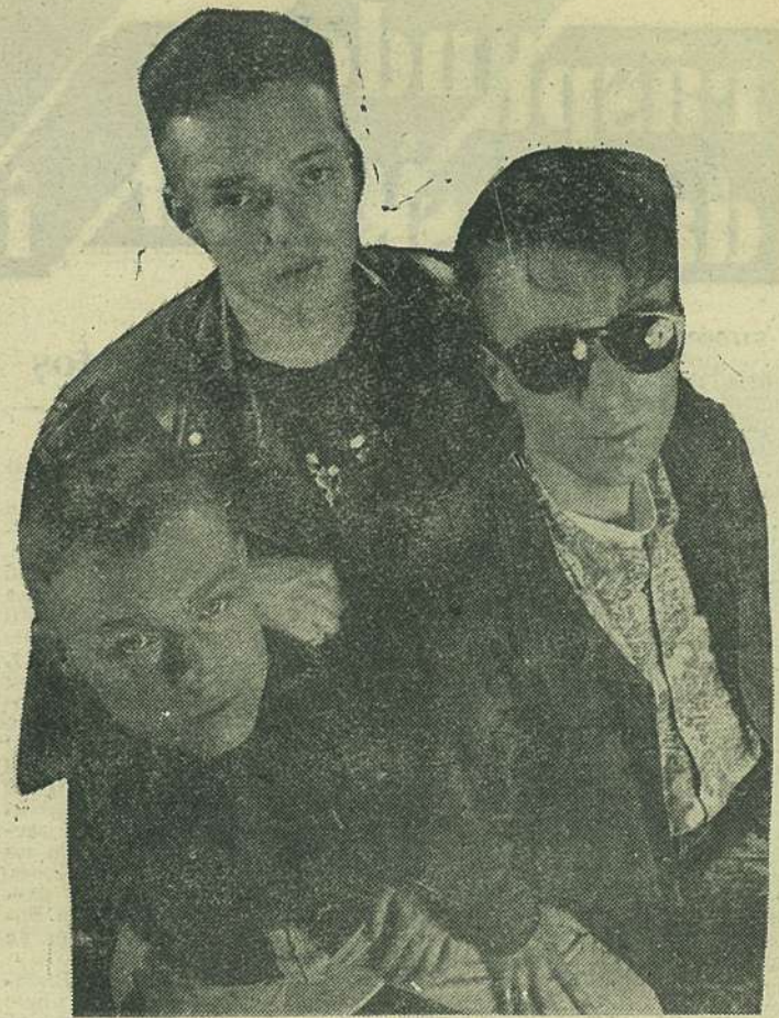
Time To Time