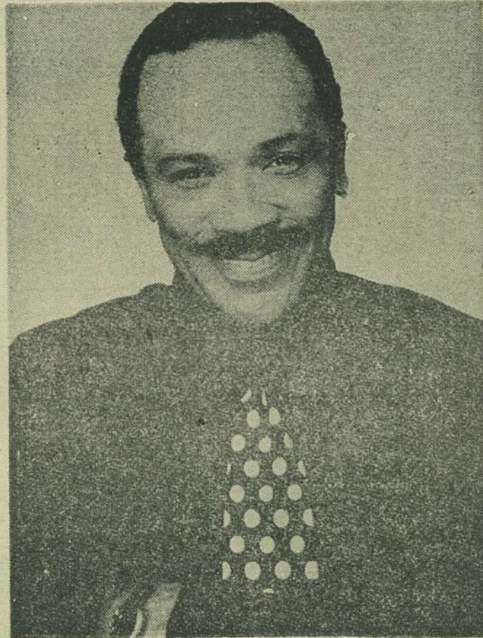
Quincy Jones a lipsit în nr. 18

● Rubrica zilelor de naștere lipsește azi, în așteptarea unei formule mai fericite, mai complexe (sport, film muzică, intern și internațional). Să nu uităm totuși citeva aniversări. 14. 06. 1961 s-a născut George Alan O'Dowd alias Boy George (revenit cu grupul Jesus Loves You); 15. 06. 1946 — Demis Roussos; 17. iunie — James Brown a împlinit 63, Barry Manilow 45; pe 18 iunie — Paul McCartney a ajuns la 49 de ani, Alison Moyet la 30. Pe 19 Paula Abdul a împlinit 28 ani iar Ann Wilson (solistă a grupului Heart) 41. La mulți ani tuturor și altor Gemeni muzicali! ● La Monaco s-a desfășurat, în prezența Prințului moștenitor Albert decernarea WORLD MUSIC AWARDS Premiile au re-