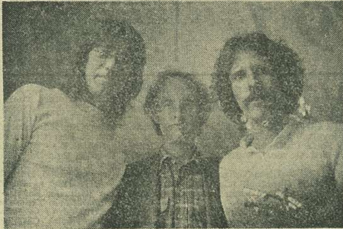
The Doors (fără Morrison)