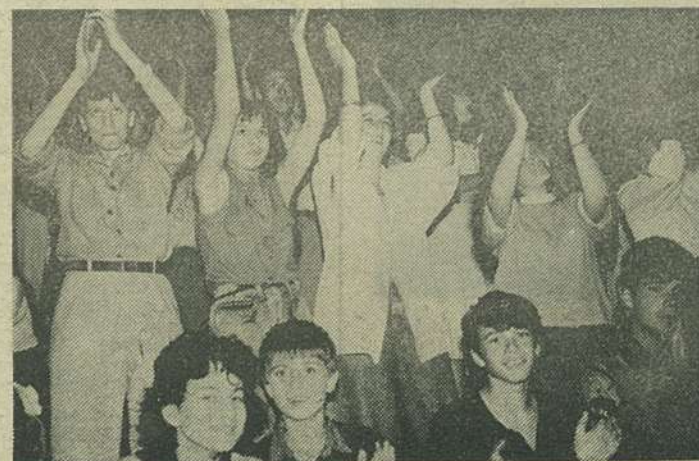
Au venit italienii... miinile sus!