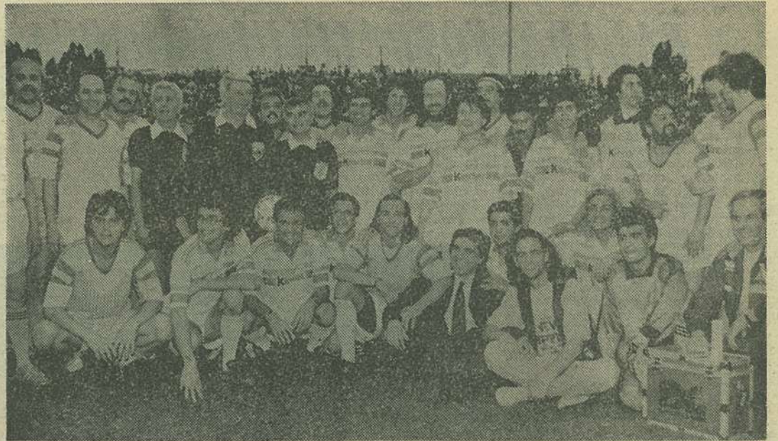
Un premiu special pentru cine-i numește pe cei 30 din fotografie