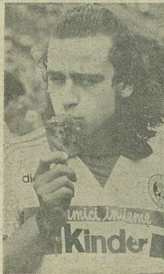
Eros Ramazzotti preferă garoafele