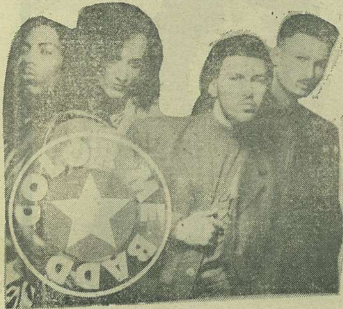
Color Me Badd

poliție. Temele lor favorite par a fi drogul, criminalitatea, sexul. Si nu în sensul critic! ● Robert Van Winkle (Vanilla Ice pentru prietenii muzicii) a fost arestat la Los Angeles pentru amenințarea cu pistolul a unei persoane într-o parcare din Hollywood. Nu se știe dacă