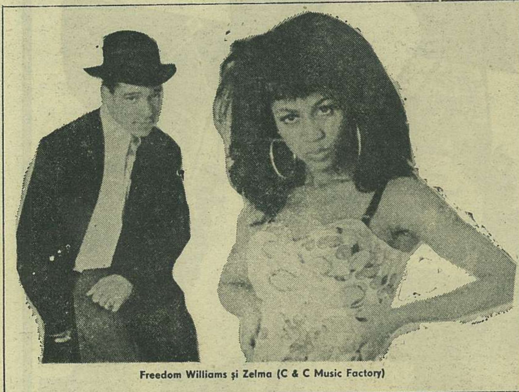
Freedom Williams și Zelma (C & C Music Factory)

următoarele sint confirmate (cu rezervele de rigoare). După aproape 30 de ani de carieră, 16 albume, și nenumărate succese pe single (enumerarea lor ne-ar lua mult spațiu), Rod Stewart își reia traseele europene cu L.P.-ul „Vagabond Heart” (pe care desigur l-ați ascultat la radio). Turneul a debutat în luna martie în Scoția natală. Cei nouă muzicieni care-l însoțesc sint Carmine