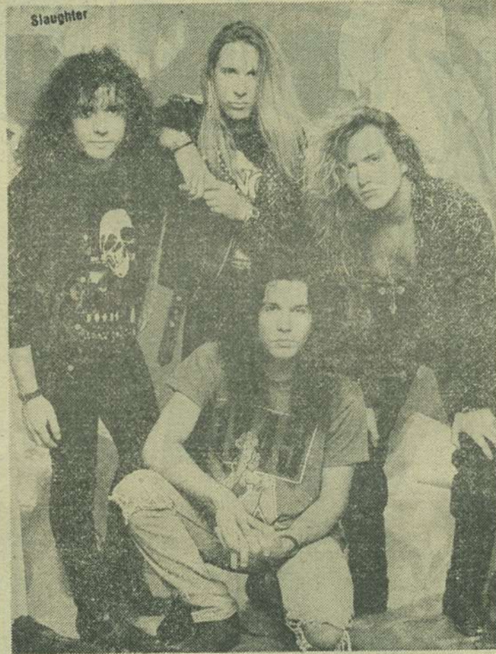
Slaughter, nerăbdători să ajungem la litera S