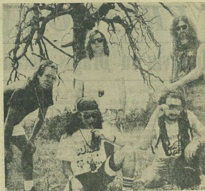
Faith No More

LITA FORD. Născută la 28 septembrie 1958 la Londra. Acum nu are o trupă anume. Fondatoare a grupului feminin Runaways împreună cu Joan Jett. Lita a cîștigat 6 ani la rînd titlul de Best Female Vocalist, oferit de cititorii revistei americane „Circus”. În 1983. Lita Ford a semnalat că este decisă spre zona hard & heavy prin albumul „Out Of Blood”. Pe discurile ei apar melodii scrise și uneori chiar interpretate de lumea bună a genului: Ozzy Osbourne, Lemmy, Nikki Sixx. S-a măritat la un moment dat cu Chris Holmes de la W.A.S.P. Gurile rele spun că n-a ținut prea mult căsnicia fiind prea heavy pentru ambii. În 1988 a obținut disc de platină cu „Lita”, care i-a garantat „piața” și pentru „Stiletto”, apărut în 1990. E de ascultat nu numai de privit!