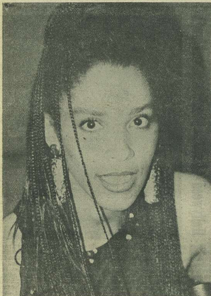
OLIA — apariție agreabilă, prietenoasă, ca toți cei din lagărul nostru.