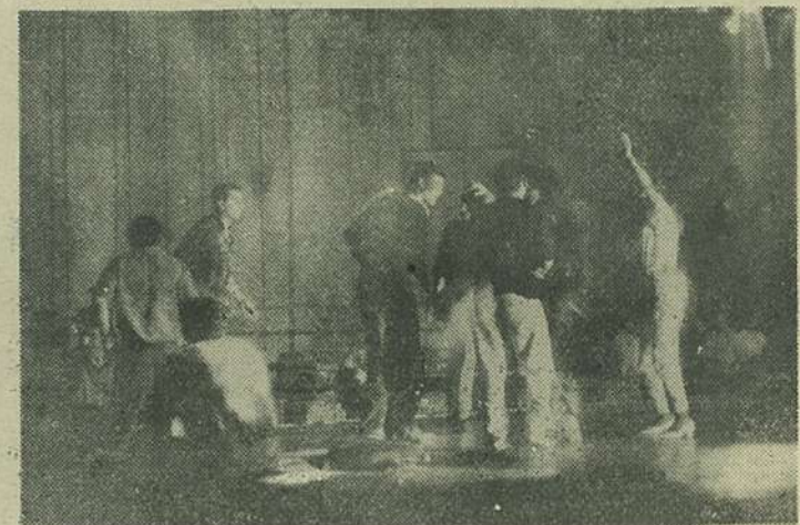
Discoteca HIPODROM — Hotel LIDO Mamaia