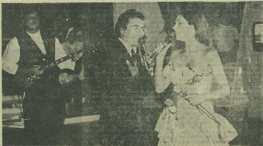
AL BANO și ROMINA POWER — au convins că sîntem foarte aproape de „muzica leggera” italiană (și la propriu și la figurat)