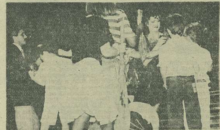
ANGELA SIMILEA încercuită, pardon, înconjurată de fani și flori...