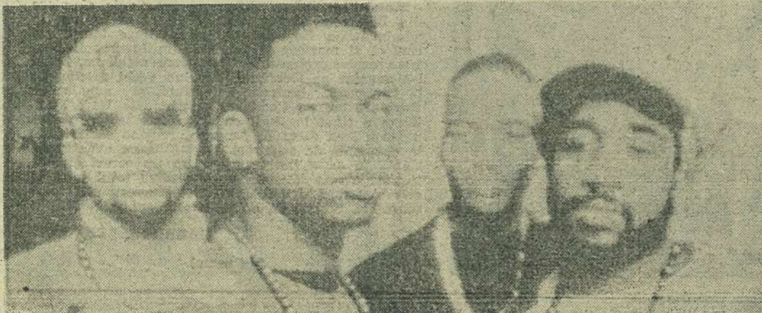
In nr. 28 text fără poză, azi invers: THE JUNGLE BROTHERS