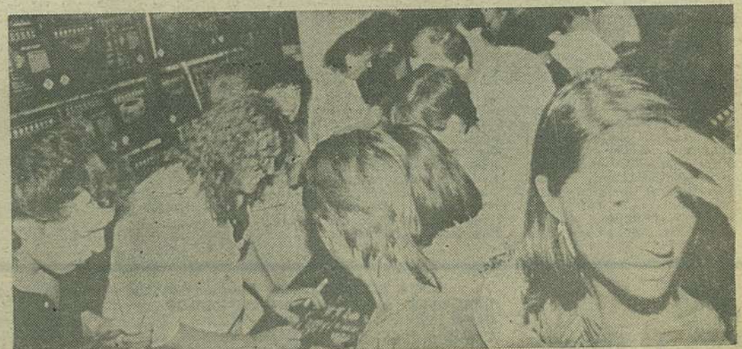
Se dau autografe la „MUZICA”. La stînga, artiștii... la dreapta, fanii