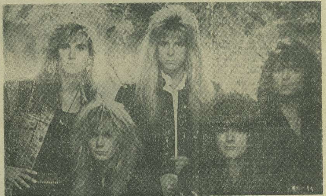
HOUSE OF LORDS