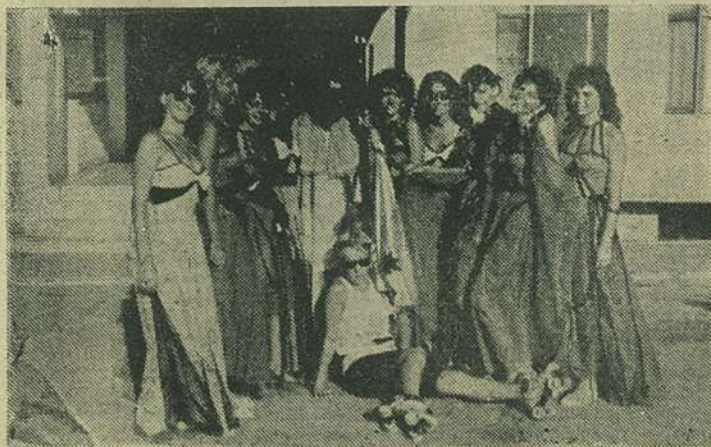
FOTO GHICITOARE. Ghiciți care dintre vestalele lui Neptun este semnatară scrisorii.