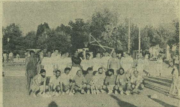
După ultimul meci „Divertis” — „Vox Maris” — 1990. Satira contra muzică 2-7