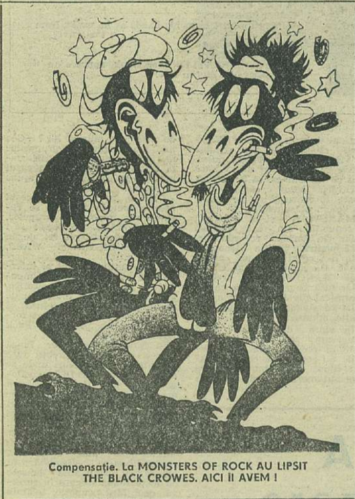
Compensație. La MONSTERS OF ROCK AU LIPSIT THE BLACK CROWES. AICI II AVEM!