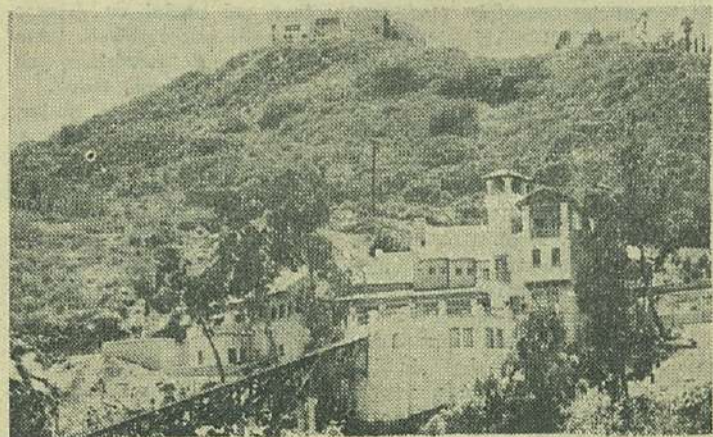
VILA DIN ENCINO UNDE MICHAEL JACKSON LOCUIEȘTE CU ÎNTREAGA FAMILIE