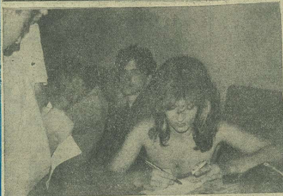
Laura Stoica scrie acasă pentru a cere bani de la părinți. Ce să-i faci, preturile de la hotel s-au schimbat brusc.