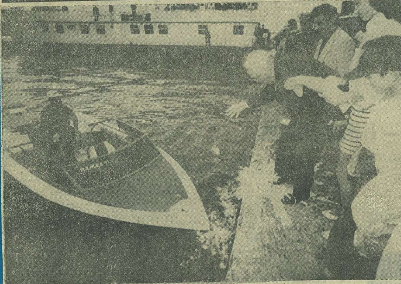
Lansare la apă cu cîntec... și cu sampanie vărsată pe pantofii prefectului! Nu e lapte, e spumos. Poza unică. N-o pierdeți!

SECUENTE DIN CONCURSUL (NE)OFICIAL DIN ULTIMA NOAPTE A FESTIVALULUI (2 septembrie, după ora 23) Au participat textieri, ziaristi, comeseni.