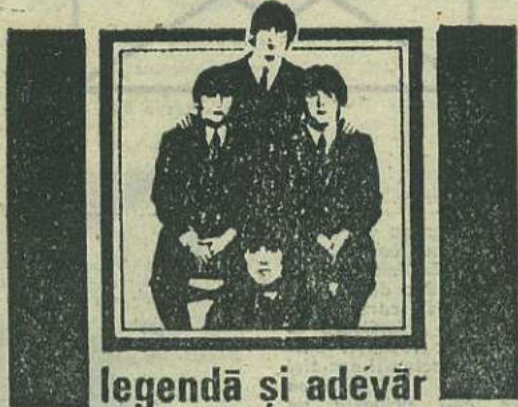
legendă și adevăr

De îndată ce au ajuns la Hilton, au fost conduși în primul rînd, în holul sălii de bal unde se adunaseră deja peste 1000 de persoane. Maharishi era o persoană micuță, îmbrăcată într-o robă de bambac, cu o coană de păr negru, care se amesteca cu barba, ceea ce îl făcea să semene cu un țap. Le-a vorbit celor prezenți despre Isus, Buddha și Dumnezeu, despre fericire veșnică și pace, despre eul interior și conștiință sublimată, despre posibilitatea de a atinge starea de nirvană, fără a face uz de mijloace exterioare cum ar fi drogurile. Meditația transcendențială practică de două ori zilnic poate face omul mai fericit, îmbunătățindu-i starea. Maharishi atinse doar suprafața acestei practici hinduse, complicată și subtilă, dar a fost suficient pentru a-i incita pe Beatles-i. Pentru a le demonstra de unde poate veni salvarea, a intrat pentru zece minute într-o stare de tranșă chiar în fața publicului. Beatles-i erau bulversați. Un sfânt care putea să-ți spună un cuvînt magic incantator, o tranșă mistică ce te putea trimite într-o lume de