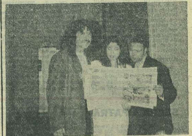
OZAN și BIK citesc P.R. & S. în traducere liberă

„Pun în cîntecul meu tot sufletul. Pentru mine nu contează