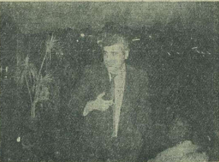
Compozitorul ANTON ȘUTEU suficient de supărat pe ce a văzut și auzit