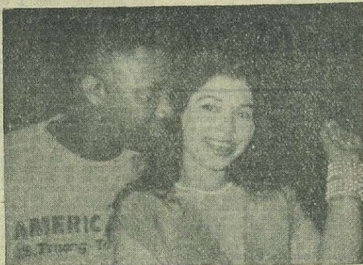
Singura fotografie a unei fete din România alături de marele Einstein (de la Technotronic)