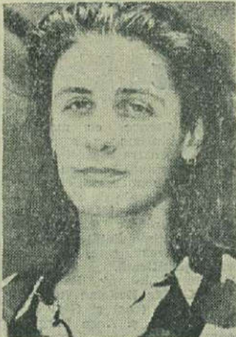
MIKE EDWARDS (Jesus Jones)

„Găsesc succesul și faima ca fiind două lucruri incredibile de atractive, continuă el. La vîrsta de cinci ani mă uitam la TV, la „Top Of The Pops” și mă gîndeam: „E minunat” să ajungi acolo. E ca o vrajă ce te cu-