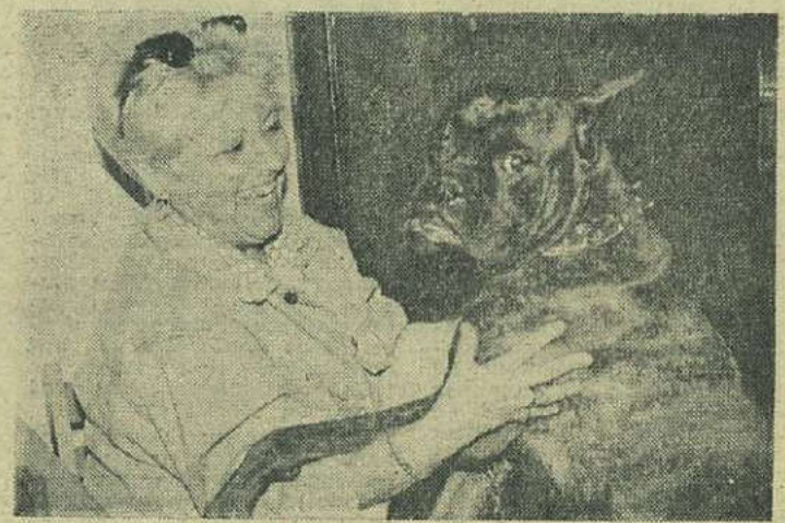
UN PRIETEN ADEVĂRAT