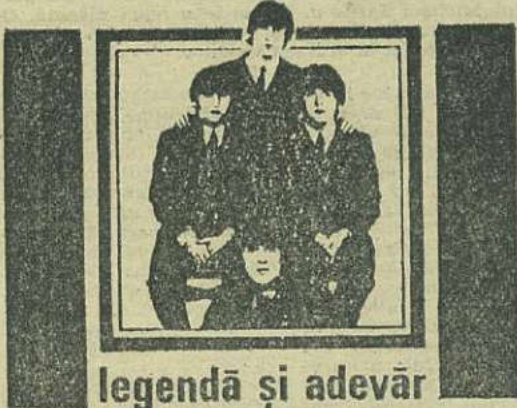
legendă și adevăr

Maharishi avea să le spună o mulțime de lucruri despre moartea lui Brian: că trecerea lui Brian în neființă era un lucru bun și nu un motiv de jale, le-a explicat diferența între viața materială și cea spirituală și le-a dat fiecăruia câte o floare să o țină în palma lor apoi să o zdrobească pentru a vedea cât de efemeră este frumusețea, o iluzie, în fond, făcută din câteva celule și apă. Le-a spus să ridă, pentru că risul ar distruge karma cea rea și l-ar ajuta pe Brian în călătoria pe care o începuse. I-a trimis să se întâlnească cu niște reporteri care aflaseră de moartea lui Brian.