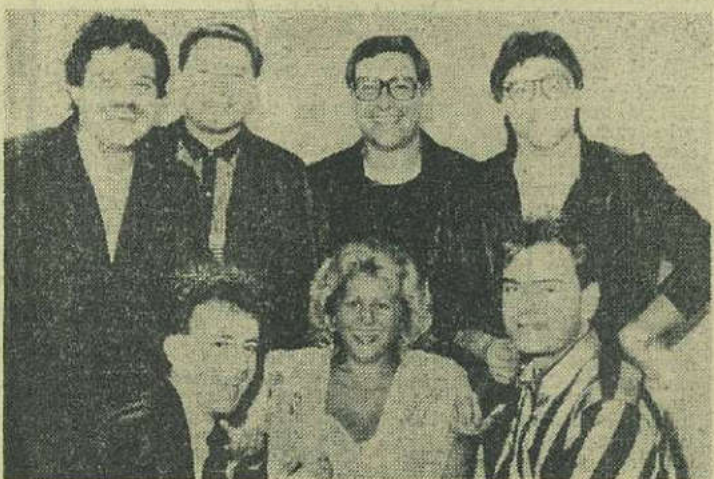
MIRABELA — ROMANTICII