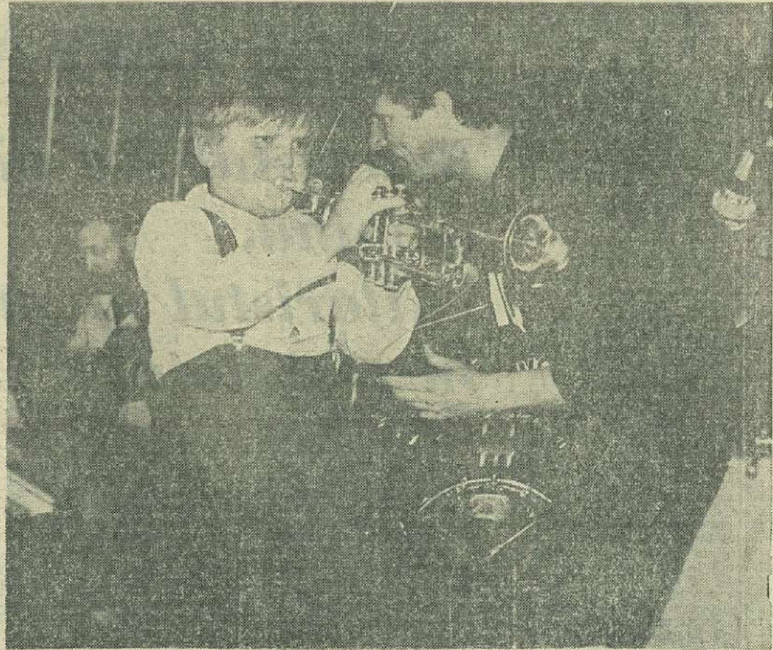
Sasha, mascota big band-ului din KRIVOI ROG