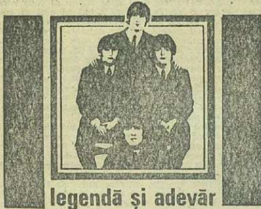
legendă și adevăr