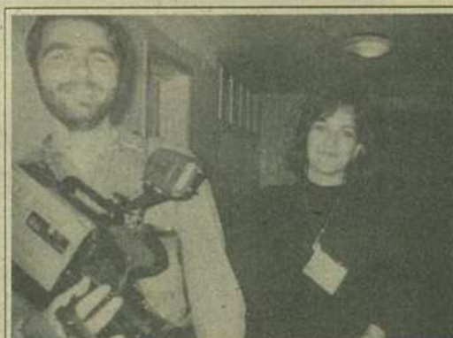
Televiziunea Română (Salut prieteni) și cea mai amabilă organizatoare

Trei seri de muzică "rock" vizînd multiplele fațete ale genului, cu distincte trimiteri în TIMP (de la "rock-baroc" la "rock" de quasi-avangardă), o avalanșă de formații mai mult sau mai puțin pregătite pentru problemele de sonorizare și aranjament scenic din sala "Olimpia", oaspeți de peste hotare, o ambianță eterogenă și, implicit, derutantă, un public surprinzător de redus numeric, oscilînd, după criterii neîntemeiate, între pasiv și incisiv - iată, în linii generale, imaginea recent încheiatului festival timișorean. Cît despre concerte, în detalii, acestea s-au desfășurat într-o formă oarecum "caleidoscopică" (pentru că a existat o permanentă alternare de elemente