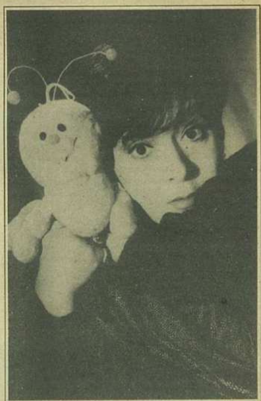
mi realizez visul de a termina o facultate. Mi-au dat posibilitatea să mă adun și să construiesc cu mîgălă mai departe.