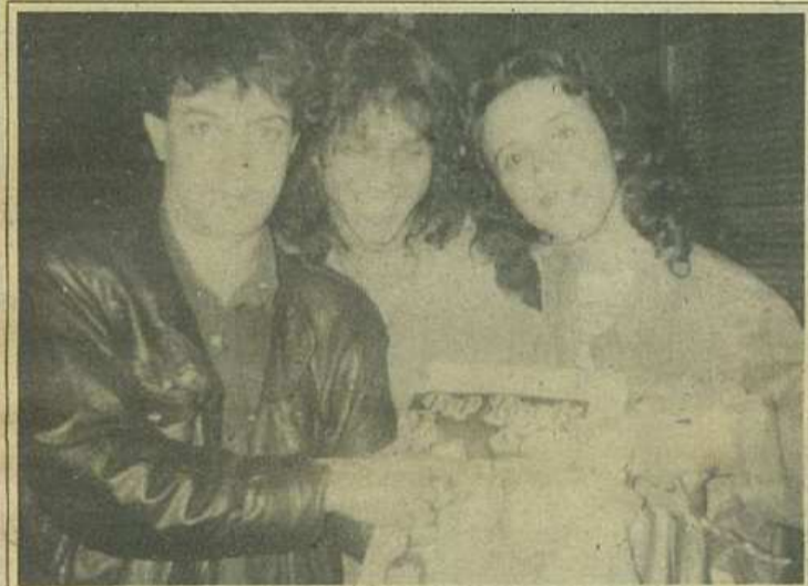
Krypton-ii citesc PR&S