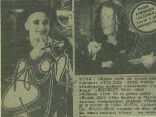
ALTAR - viltosare stete ale thrash-ului românesc • Thin Lizzy - detaliu promise • Dezagărea scriitorilor misterioase "Tata dragă" • BUCUREȘTI '92 din culise • Polifonia "TOP 50" la prima editie • Brandu Story • The Beatles și "Pictorii Jackson" • Intermisiile prieteni • Tăturii de la posturi de radio: Uni-Plus, Contact, Chi, Războiul • Lansări de disc, vite din lumea rockului • Omagii - un omagiu