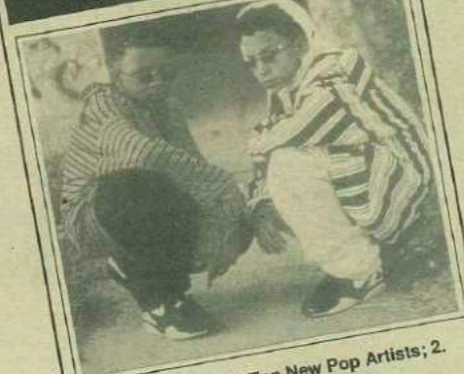
Kriss Kross: 1. Top New Pop Artists; 2. Hot Rap Artists; 3. Hot 100 Singles