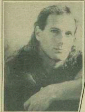
Michael Bolton: 2. Top Billboard 200 Album Artists Male