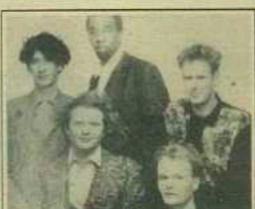
Simply Red: 1. L.P.'s "N.M.E."