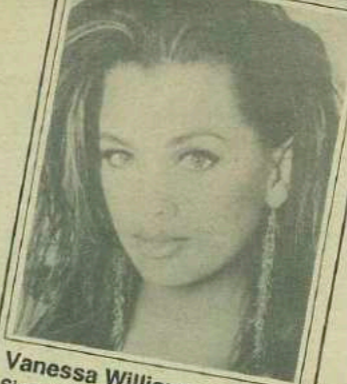
Vanessa Williams: 2. Hot 100 Singles Artists; 4. Hot 100 Singles