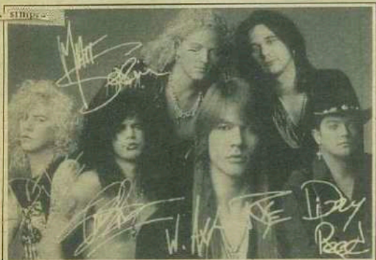
Guns N'Roses: 3. Top Pop Artists