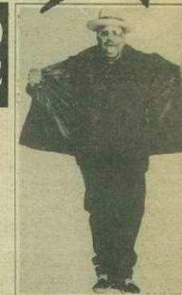
Sir Mix - A - Lot: 2. Hot 100 Singles Male; 2. Hot 100 Singles