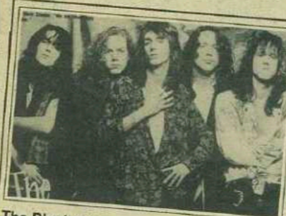
The Black Crowes: 2,9 Top Album Rock Tracks