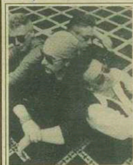
U 2: 5. Top Billboard 200 Albums; 7. Top Album Rock Tracks