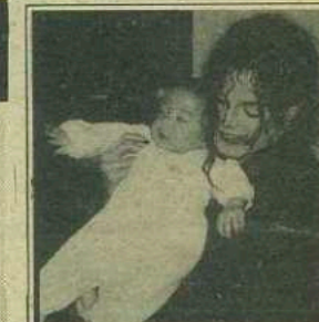
Michael Jackson: 1. Hot 100 Singles Male; 1. Hot Dance Music; 2. Billboard 200 Albums