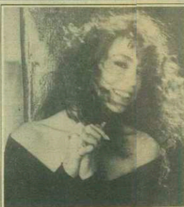
Mariah Carey: 1. Hot 100 Singles Artists; 1. Billboard 200 Album Artists - Female