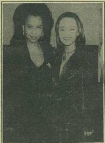
Doă prietene de ultimă oră: Neneh Chery și Vanessa Paradis