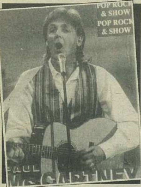
Hope Of Deliverance

I will always be hoping, hoping You will always be holding, holding My heart in your hand I will understand/ I will understand someday One day You will understand always, always From now until then/ When it will be right, I don't know What it will be like, I don't know We live in hope of deliverance From the darkness that surrounds us/ Hope of deliverance Hope of deliverance Hope of deliverance From the darkness That surrounds us/ And I wouldn't mind knowing, knowing That you wouldn't mind going Going along with my plan/ When it will be right, I don't know What it will be like, I don't know We live in hope of deliverance From the darkness that surrounds us/ Hope of deliverance Hope of deliverance Hope of deliverance From the darkness That surrounds us/ (two times) / Hope of deliverance Hope of deliverance I will understand