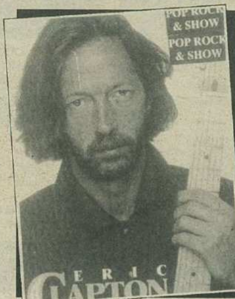
Tears In Heaven

Would you know my name If I saw you in heaven Would it be the same If I saw you in heaven I must be strong and carry on 'Cos I know, I don't belong Here in heaven/ Would you hold my hand If I saw you in heaven Would you help me stand If I saw you in heaven I'll find my ways Through night and day 'Cos I know I just can't stand stay here in heaven/ Time can bring you down Time can bend your knees Time can break your heart Have you begging please Begging please/ Beyond the door There's peace I'm sure And I know there'll be No more tears in heaven/ Would you know my name If I saw you in heaven Would you be the same If I saw you in heaven I must be strong and carry on 'Cos I know I don't belong Here in heaven