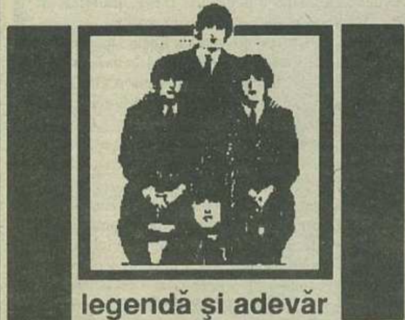
legendă și adevăr

Pattie și-a parcat mașina în spatele magazinului și nu a lipsit multă vreme. Când a revenit, a constatat că cineva îi pusese pe bord un pachet de țigări Rothman's, iar în interior era un număr de telefon, numele unui bărbat și mesajul: "Telefonează-mi". Mai era și un mic dar. O bucăciță de hașiș. Pattie a pus pachetul în poșetă și s-a întors acasă pentru a face o baie. Când tocmai se ștergea, soneria a sunat. S-a uitat pe fereastră și a văzut că tocmai parcau 3 sau 4 mașini. Mirată, căci nu aștepta pe nimeni, s-a dus să deschidă.