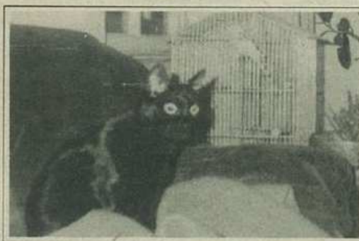
Coco și Musette

au fost câteva voci remarcabile dar nu cred că nu ne-am descurca cu soliștii noștri de aceeași vîrstă într-o astfel de competiție. Și la Sanremo a fost necesar ca cineva să le reamintească tuturor că este un concurs de creație și nu de interpretare.